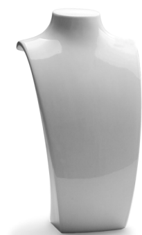
CLB 149 182x158x368 mm